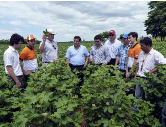
Parcela demostrativa del algodón Bt-RR, en San Pedro, con la visita del entonces ministro Enzo Cardozo, entre otros.

Preparan la liberación definitiva del algodón GM -- La Comisión Nacional de Bioseguridad (Conbio) tiene muy avanzado el proceso de liberación comercial definitiva del algodón genéticamente modificado (GM), Bt-RR, anunciaron ayer fuentes del MAG.