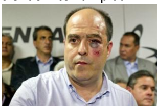
Diputado Julio Borges

Diputados opositores son agredidos en Parlamento venezolano -- Varios diputados de la oposición fueron golpeados en la Asamblea Nacional en una sesión que terminó siendo interrumpida.